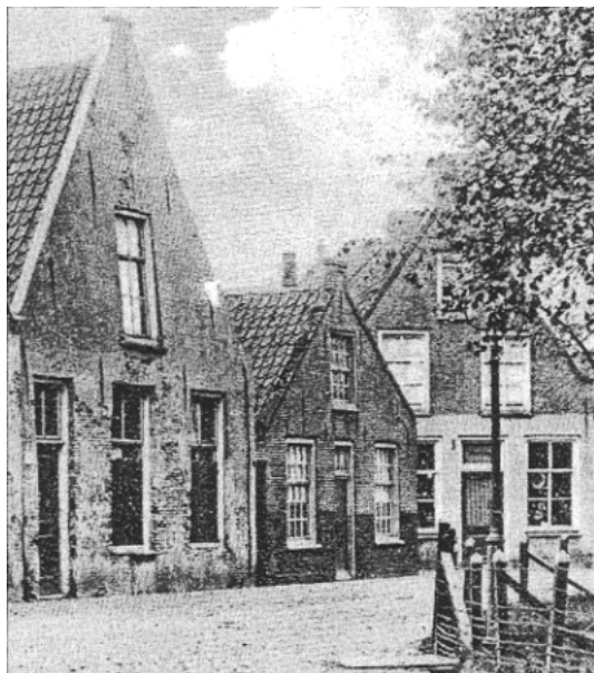
Het meest links het gasthuis.

Al 5 dagen na zijn eerste verjaardag was Pieter wees. In Middelharnis was een gasthuis waar ook wezen werden opgevangen, aan de Ring achter de kerk. De foto hiernaast toont een tamelijk vervallen staat. Er staat inmiddels ook ander huis op die plek.